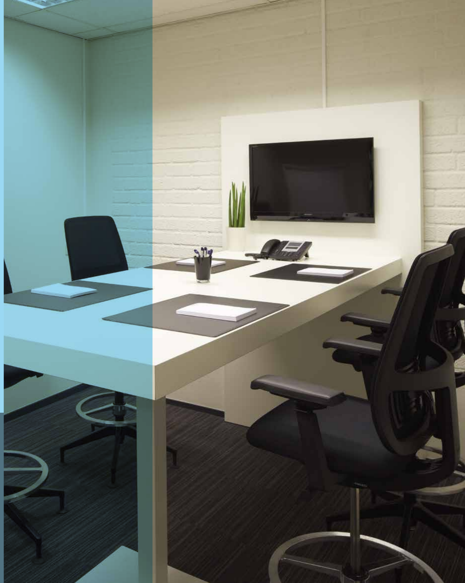
foto 1 : Het gebouw stond vier jaar leeg totdat Officenter het nieuw leven wist in te blazen.